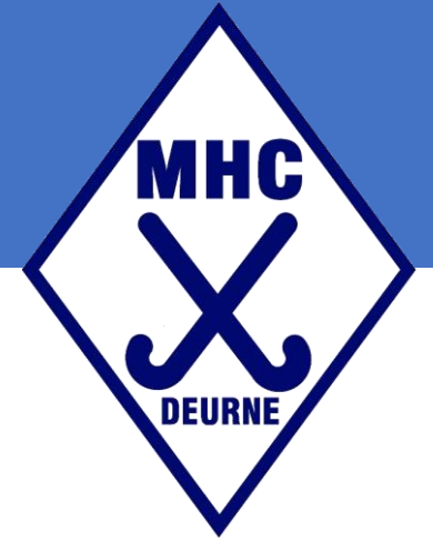
BIJLAGE 2 – HEKWERK MHC DEURNE